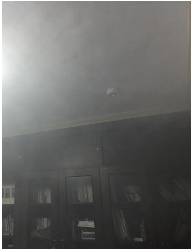
偵測到濃煙時，警報器作動