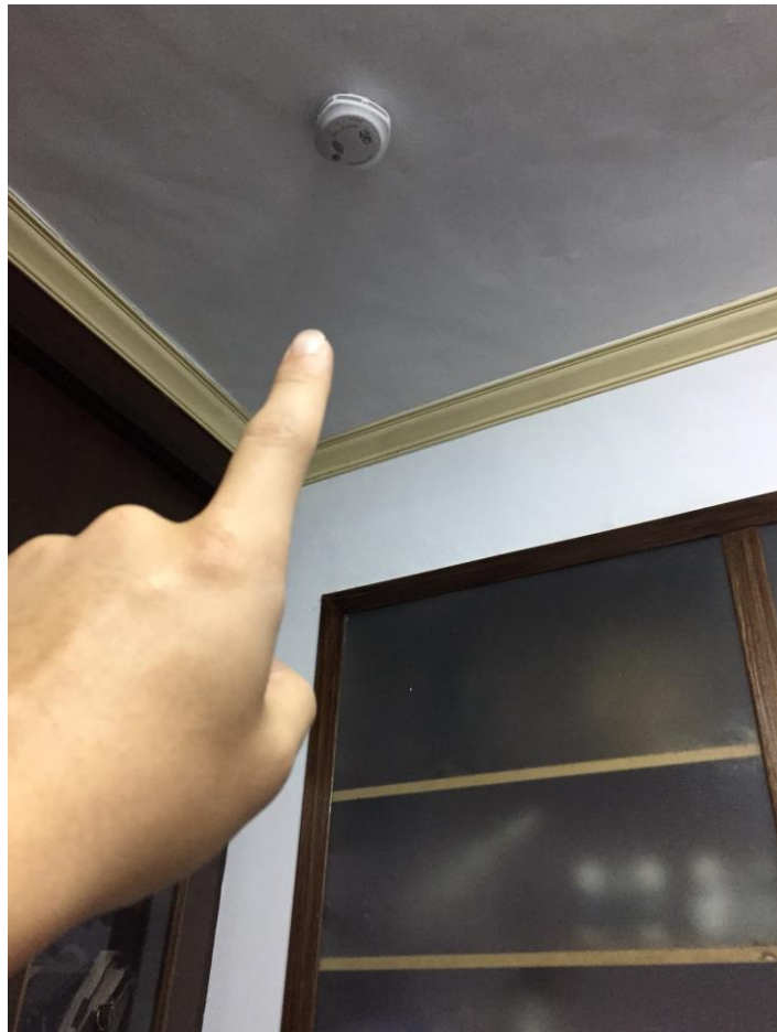
住宅用火災警報器裝設於一樓書房