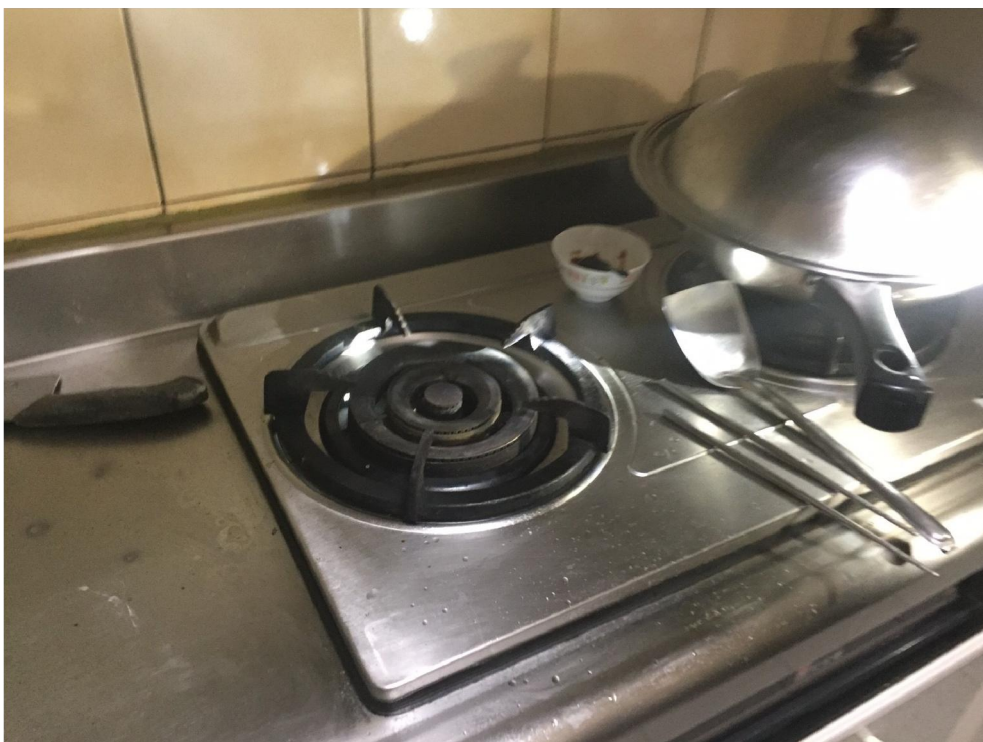
現場燃燒情形照片