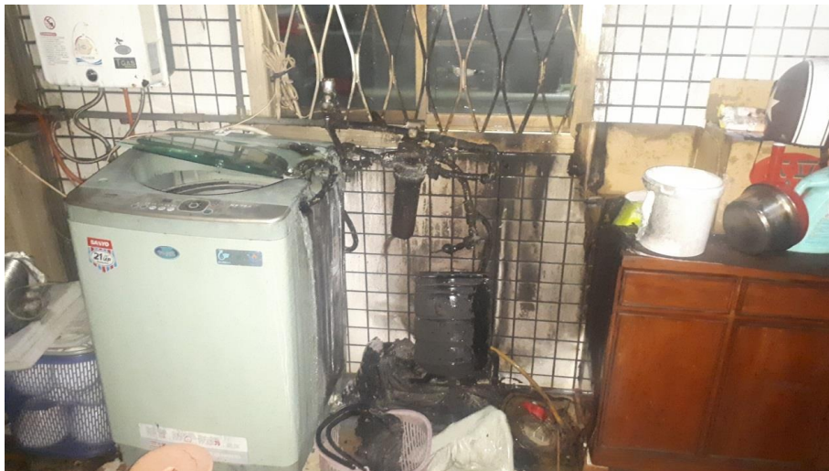
現場燃燒情形照片