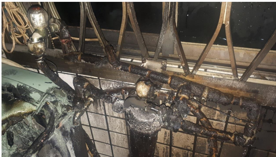
現場燃燒情形照片