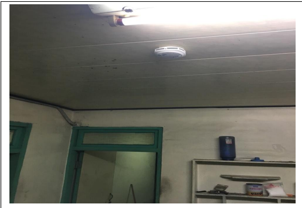
圖二:住警器裝置位置