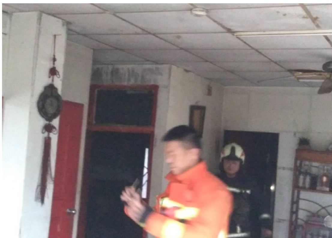
相片說明：住宅用火災警報器於起火處發出警報。