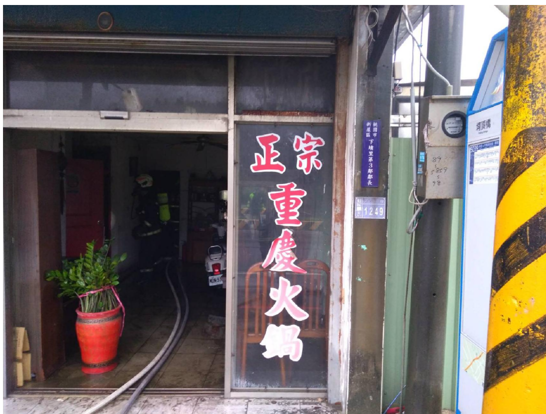
相片說明：一樓客廳起火處瀰漫濃煙，牆壁有燻黑情形。